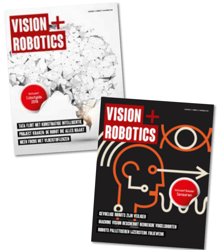
Vision & Robotics statistieken

Vision & Robotics biedt verschillende mogelijkheden om online en offline te adverteren. Denk hierbij aan een advertentie, branded content, online bannering of online advertorials. Deze mediakaart biedt u een overzicht van de standaard mogelijkheden. Maatwerk is uiteraard ook mogelijk. Onze media-adviseur helpt u graag met het bepalen van een passende (multimediale) campagne om uw marketingdoelstellingen te behalen.